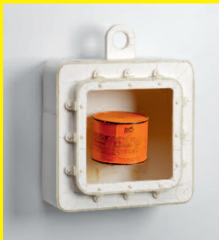
Hermes Gift Gas Youth Model (Hermes Giftgas Ungdomsmodel), 1998 Kunstner: Tom Sachs