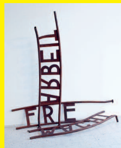
Untitled (Arbeit Macht Frei) (Uden titel (Arbejde Gør dig Fri)), 2010 Kunstner: Jonathan Horowitz